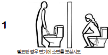
필요한 경우 변기에 소변을 보십시오.